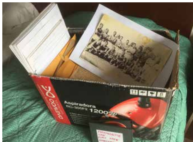
Het tijdelijk onderkomen van de collectie Guno Hoen, hier op een hotelbed in de Eco Resort Inn in Paramaribo.

Aan de Koninklijke Bibliotheek in Den Haag werd een advies gevraagd over de wijze waarop de fotocollectie het beste gedigitaliseerd zou kunnen worden. Men was via het internet attent gemaakt op de collectie literaire en historische bronnen die beschikbaar is in de Digitale Bibliotheek voor de Nederlandse Letteren. Deze was ontwikkeld nadat Suriname in 2003 geassocieerd lid was geworden van de Nederlandse Taalunie. De collectie omvat de teksten van bronnen variërend van Herlein's Be-